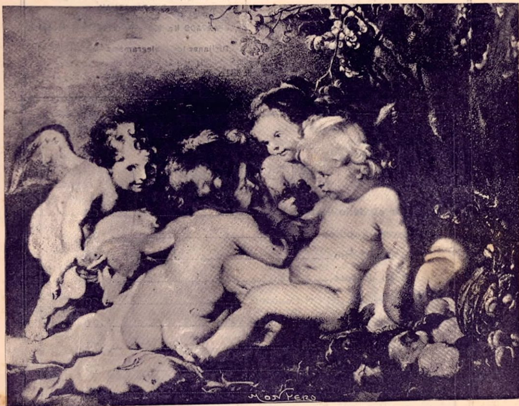
Pintura de Rubens.—El Niño Jesús en compañía de Juan y dos Angeles

REDACTORES Y DIRECTORES: SIDNEY W. EDWARDS y JAIME BRENES REVISTA EDUCACIONAL